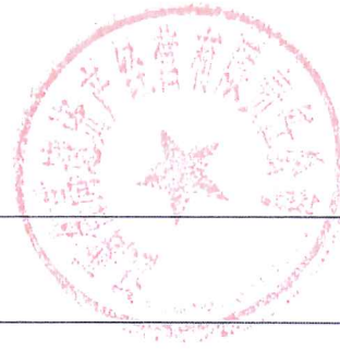
附表 6 资格条件(其他要求)