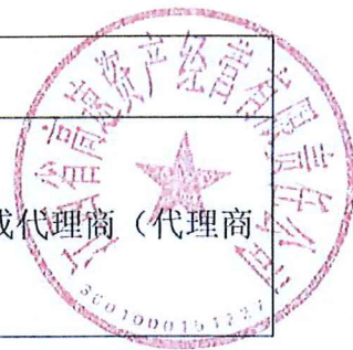
附表2 资格条件(财务最低要求)